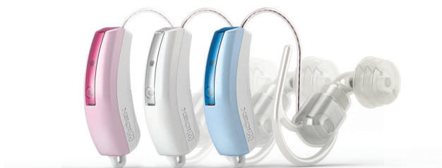
Pearl pink, Pearl white, Pearl blue